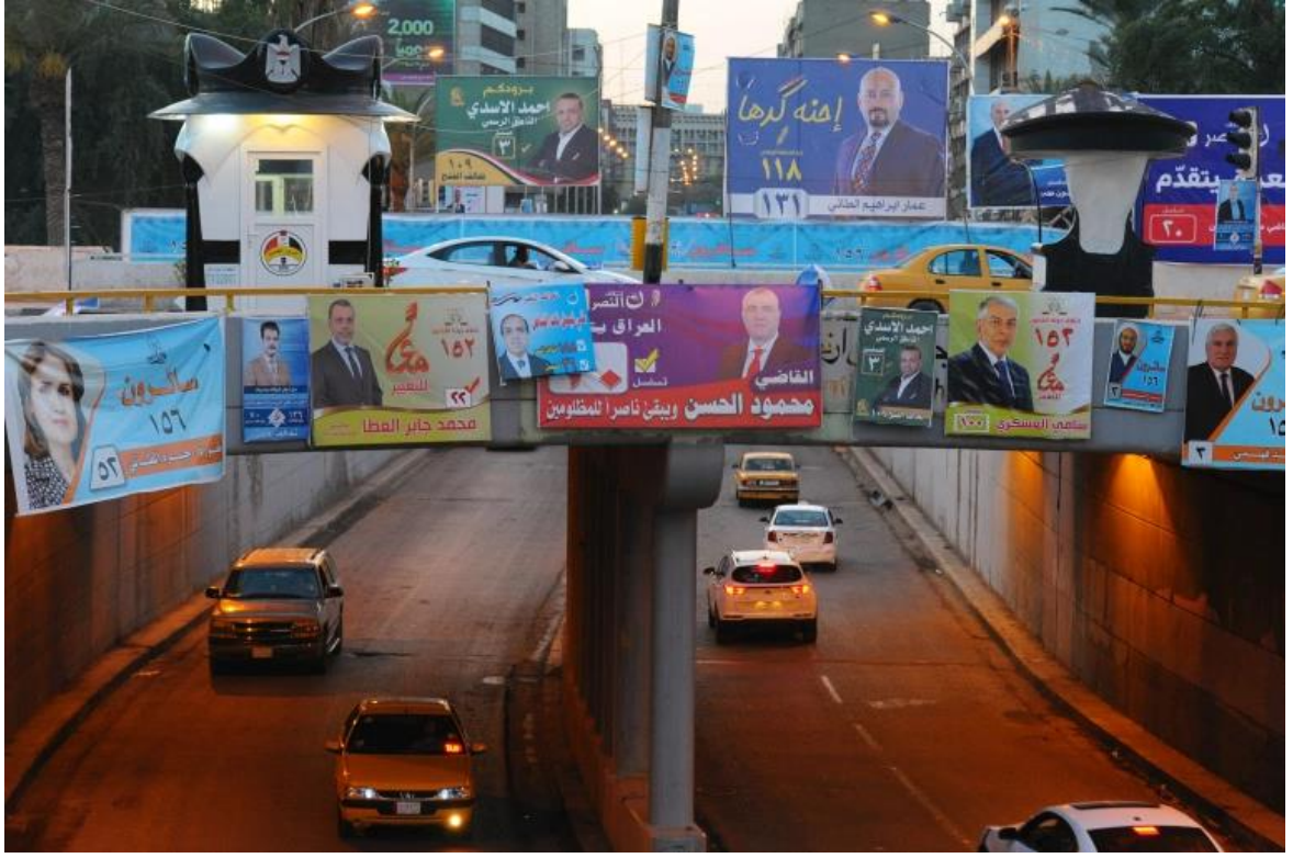
يشارك في الانتخابات العامة بالعراق 3249 مرشحا يتنافسون على 329 مقعدا