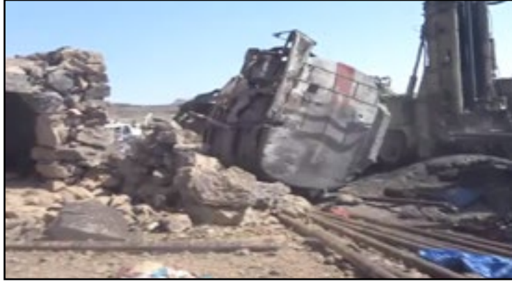
استهداف طيران العدوان حفارة آبار مياه مُديريّة أرحب بمحافظة صنعاء 10 سبتمبر 2016م

69. الجدول رقم (3) المُرفق بملحق هذا التقرير يوضح بعض المواقع الخاصة بمياه الشرب والرّي والتي استهدفتها دول تحالف العُدوان الأمريكي السعودي الإماراتي.