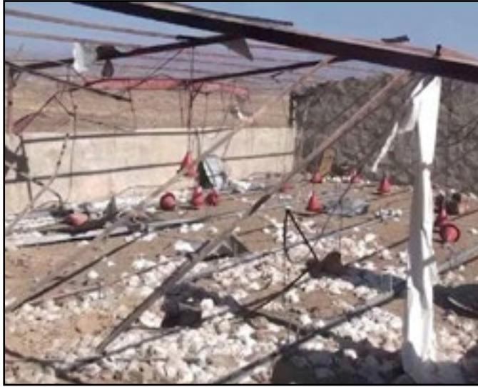
استهداف العدوان مزرعة دواجن بمديرية حجانه صنعاء 25 سبتمبر 2016م

67. الجدول رقم (2) المرفق بملحق هذا التقرير يوضح بعض المواقع الخاصة بالثروة الزراعية والحيوانية التي استهدفتها دول تحالف العدوان.