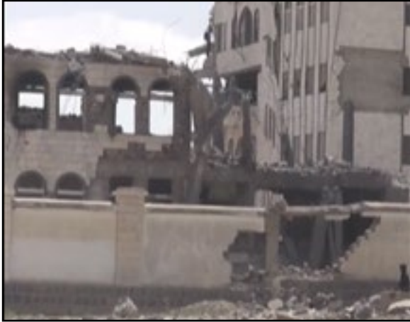
استهداف العُدوان للمجمع القضائي بمحافظة عمان 30 أغسطس 2016