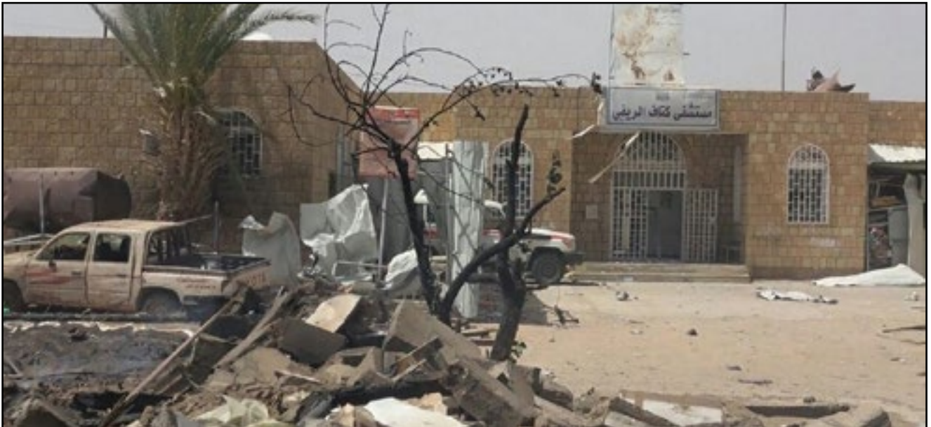
استهداف طيران تحالف العدوان مستشفى كتاف - محافظة صعدة 26 مارس 2019م