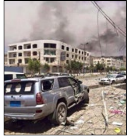
استهداف طيران تحالف العدوان منطقة فج عطان بالعاصمة صنعاء 20 أبريل 2015م