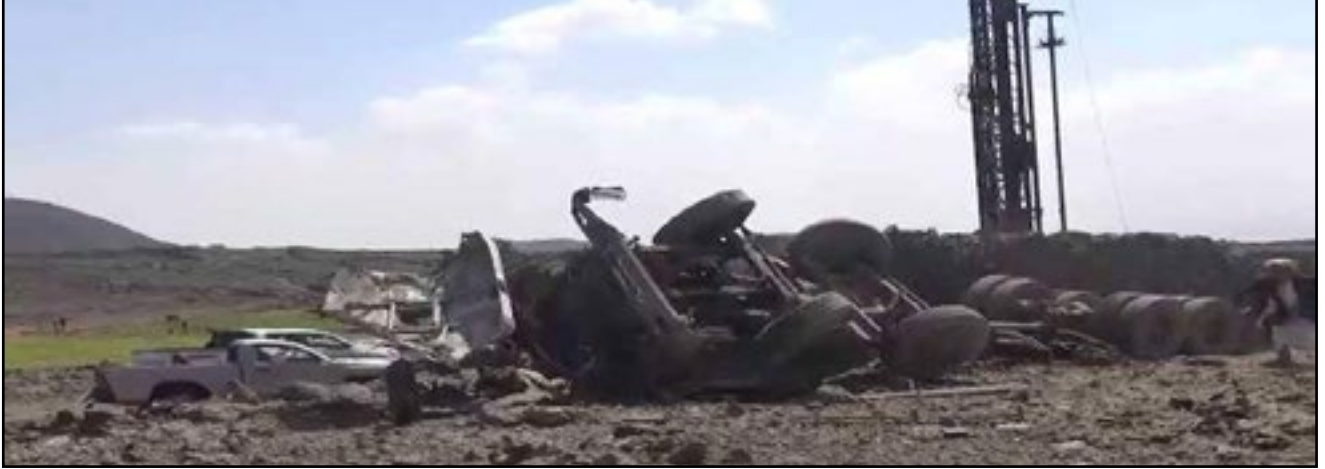
استهداف طيران تحالف العدوان حفار مياه - مديرية أرحب بمحافظة صنعاء 10 سبتمبر 2016م

80. في فجر العاشر من سبتمبر 2016م استهدفت طائرات تحالف العدوان الأمريكي السعودي الإماراتي إرتوازاً للمياه في قرية بيت سعدان، بمديرية أرحب بمحافظة صنعاء، وأصابت مَخيماً للعاملين فيه، وعلى إثر تلك الضربة قُتل وجرح من كان نائماً في المَخيم، وعندما سمع السكّان الانفجار الناتج من الغارات تحرّكوا بسياراتهم ووسائل النقل المتاحة؛ لمعرفة أسباب الانفجار وإسعاف الضحايا، وعند تجمّع الناس من كافة القرى المجاورة قامت طائرات تحالف العدوان باستهداف التجمّع البشري والمُسعفين؛ ممّا أدى إلى مقتل 27 مدنياً وجرح 107 من المواطنين المدنيين.