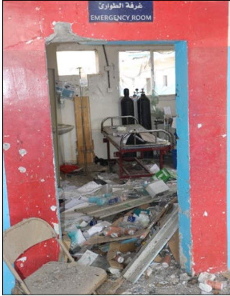
استهداف طيران تحالف العدوان مستشفى عبس - محافظة حجة 15 أغسطس 2016م

96. الجدول رقم (6) المرفق يُوضِّحُ بعضَ المُستشفياتِ والمراكزِ الصَّحِّيَّةِ التي تمَّ استهدافُها بشكلٍ مُتعمَّدٍ من قبل دول تحالفُ.