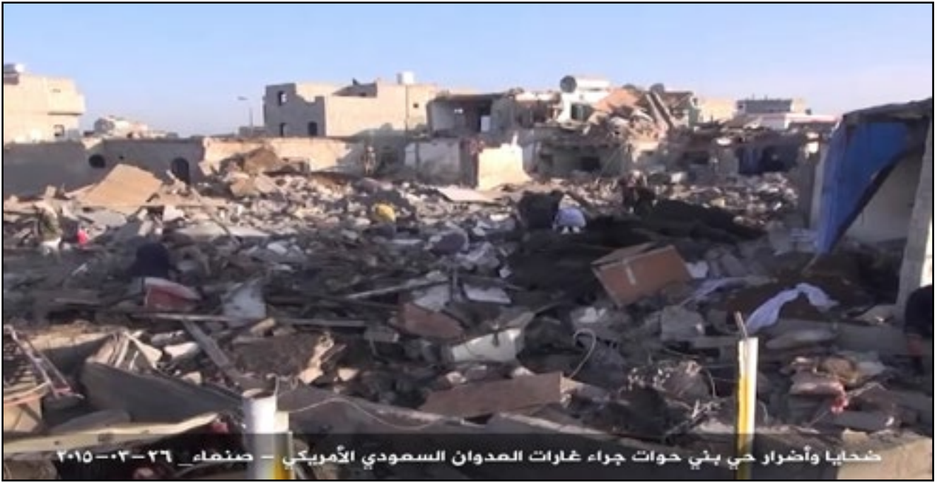
ضحايا وأضرار حي بني حوات جراء غارات العدوان السعودي الأمريكي - صنعاء ٢٦-٢-٢٠١٥

استهداف طيران تحالف العدوان منزل سكني - منطقة بني حوات شمال أمانة العاصمة