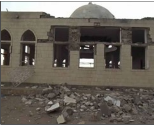
قصف تحالف العدوان لمسجد بمحافظة صعدة 17 يوليو 2015م