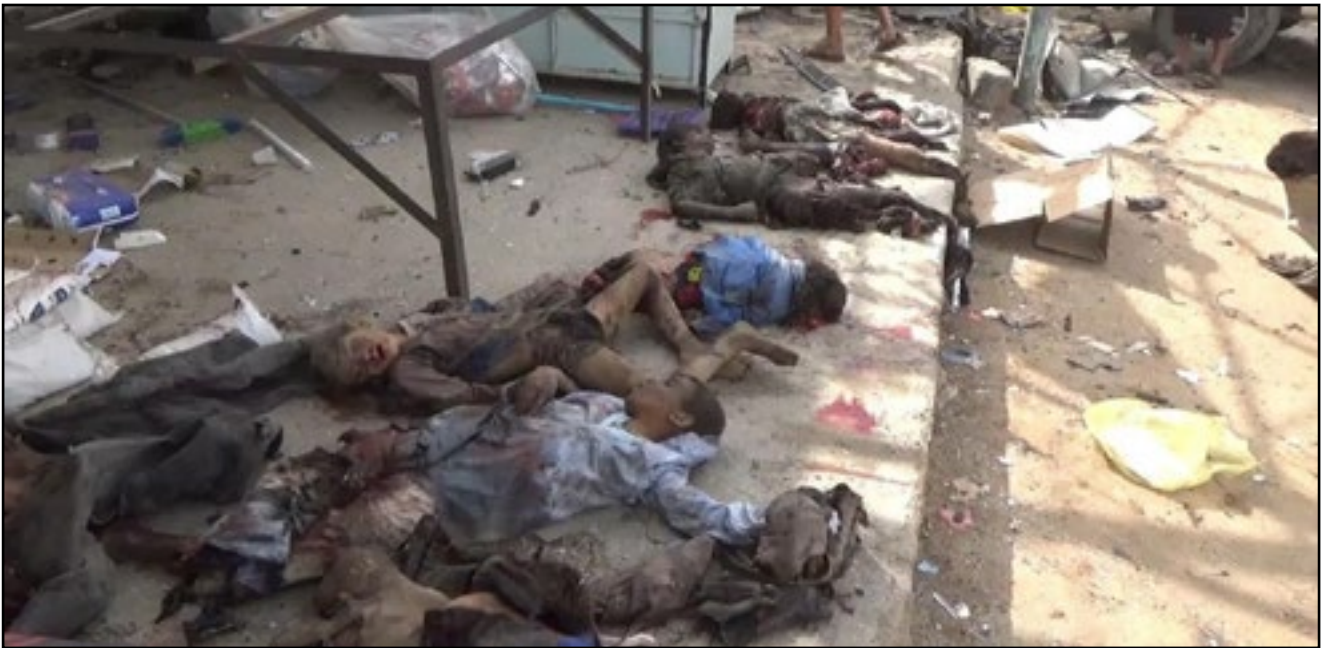
استهداف طيران تحالف العدوان حافلة تقل أطفال بمنطقة ضحيان - محافظة صعدة 9 أغسطس 2018م