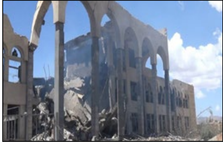
استهداف تحالف العُدوان المحكمة القضائيّة صعدة 6 مايو 2015م

124. الجدولُ رقم (13) في الملحق يُوضّح تفاصيلٍ إحصائيّةٍ للمُنشآت القضائيّة التي استهدفها تحالفُ العُدوان.