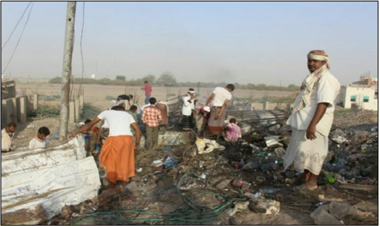
استهداف طيران تحالف العدوان سوق شاجع - مدينة زبيد بمحافظة الحديدة 12 مايو 2015م