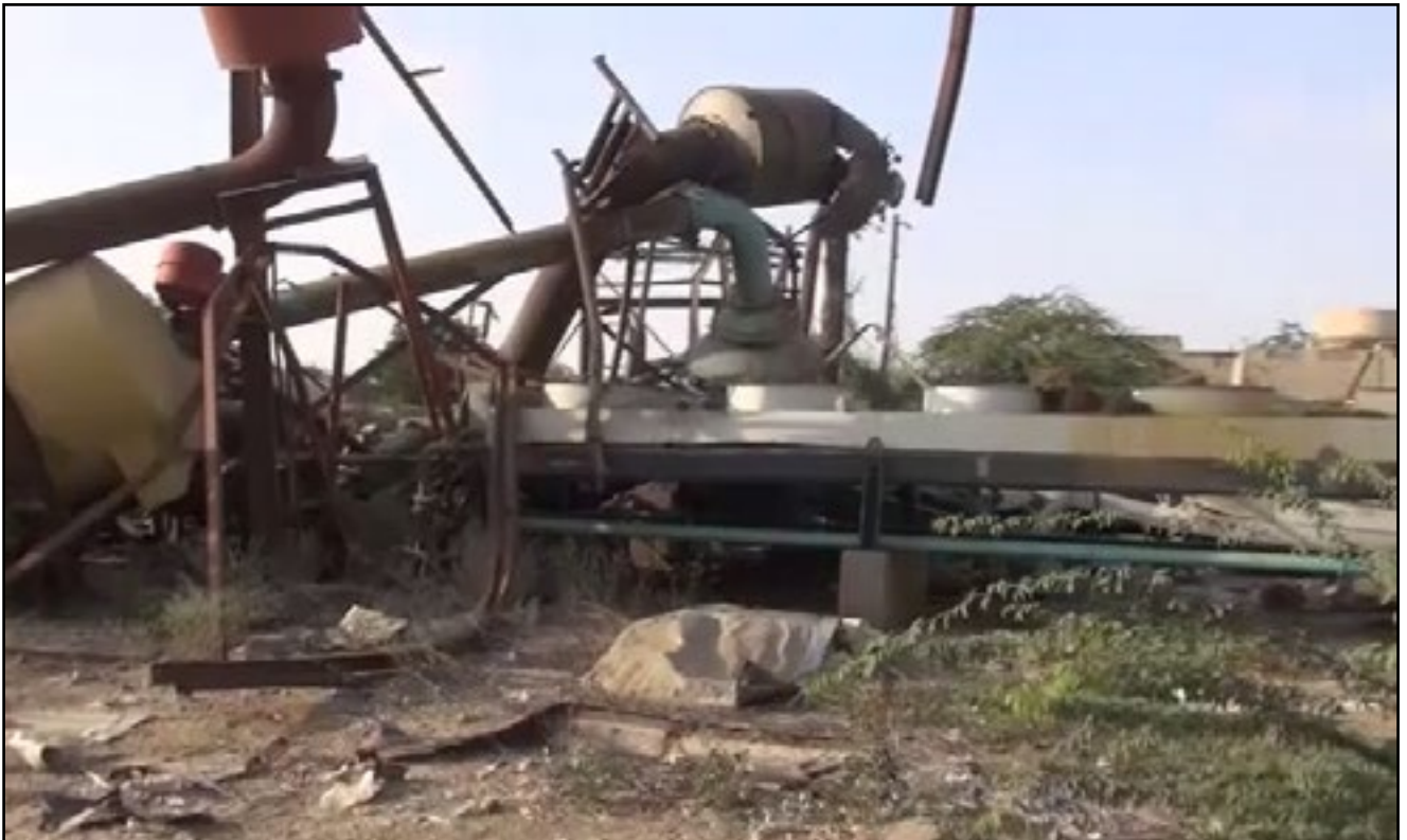
استهداف تحالف العدوان لمحطة توليد كهرباء - مديرية حرض بمحافظة حجة 17 يناير 2016م

121. وتشير الإحصائيات الأولية إلى تدمير نحو (538) منشأةً وشبكة ومحطة كهرباء تدميراً كلياً وجزئياً منذ بداية العدوان.