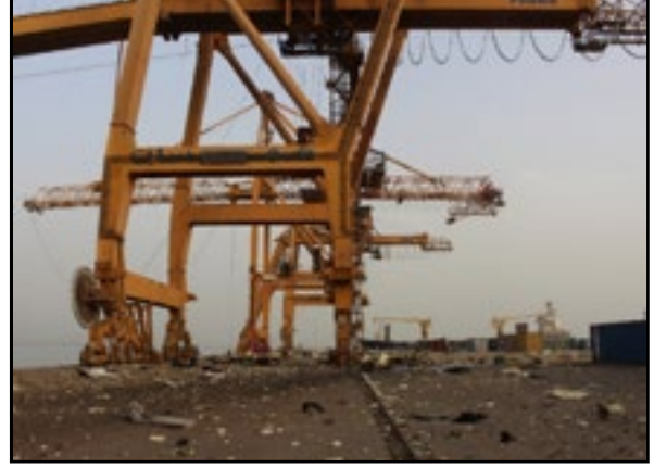
استهداف تحالف العُدوان ميناء الحديدة 1 سبتمبر 2015م

117. الجدول رقم (11) في الملحق يبيّن قائمة المنشآت البحريّة التي استهدفتها دولُ تحالفِ العُدوان.