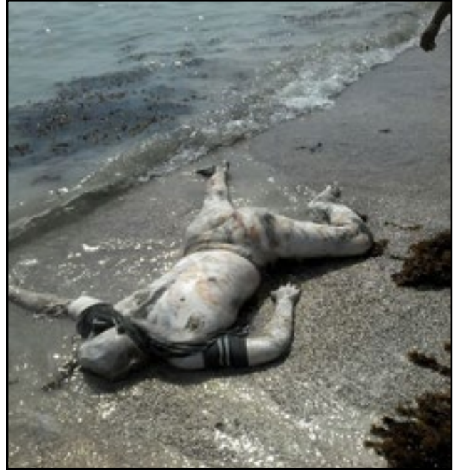
استهداف طيران تحالف العدوان قوارب صيادين - جزيرة عقبان بمُحافظة الحديدة 22 أكتوبر 2015م