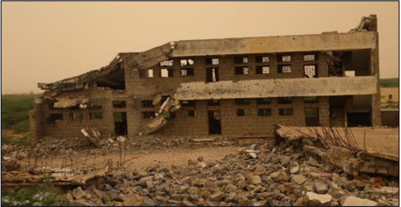
استهداف طيران تحالف العدوان مدرسة- مديرية بكيل المير محافظة حجة 6 يونيو 2015م