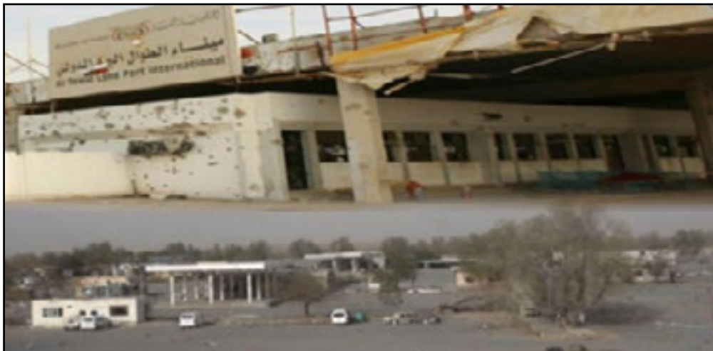
صور الأضرار التي تعرض لها منفذ الطوال بسبب الاستهداف المتكرر لطيران تحالف العُدوان