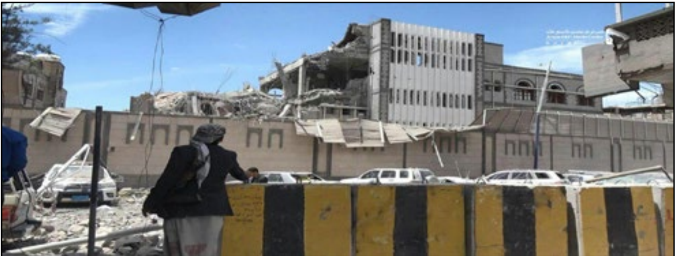
استهداف طيران تحالف العدوان مبنى مكتب رئاسة الجمهورية بمديرية التحرير - العاصمة صنعاء 7 مايو 2018م

89. في صباح يوم الاثنين الموافق 7 مايو 2018م استهدف طيران دول تحالف العدوان مبنى مكتب رئاسة الجمهورية والذي يقع وسط العاصمة صنعاء بمديرية التحرير وفي حي يعد من أكثر الأحياء كثافة سكانية وفي الوقت الذي كان المكتب يحتضن بالموظفين، وعاود الطيران استهداف المسعفين بغارة أخرى مما ضاعف أعداد الضحايا إلى أكثر من 100 مدني بين قتل وجريح وتسبب بأضرار بالغة في المبنى المستهدف وتضرر عدد كبير من المباني المجاورة.