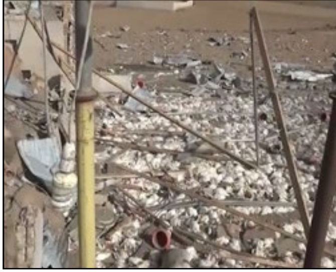
استهداف العدوان مزرعة دواجن بمديرية سنحان بمحافظة صنعاء 4 مارس 2016م

ارشادياً زراعياً، و6 محاجر نباتية وبيطرية، و 81 سوقاً ومركزاً ومخزن تخزين وتبريد زراعي مركزياً وريفياً، و41 جمعية زراعية تعاونية، و11 مشتل إنتاجياً، و6,632 حقلاً زراعياً ومزرعة مواشي (أبقار، أغنام، ماعز، جمال)، و395 مزرعة دواجن وفقاسة بيض ومعامل أعلاف، و35 منحل عسل، و41,575 خلية نحل، و24 مخزن تبريد، و1,016 مزرعة انتاج محاصيل، و40 سوقاً زراعية ريفية، و118 حضيرة مواشي وأبقار، و114 حراثة وحصادة.