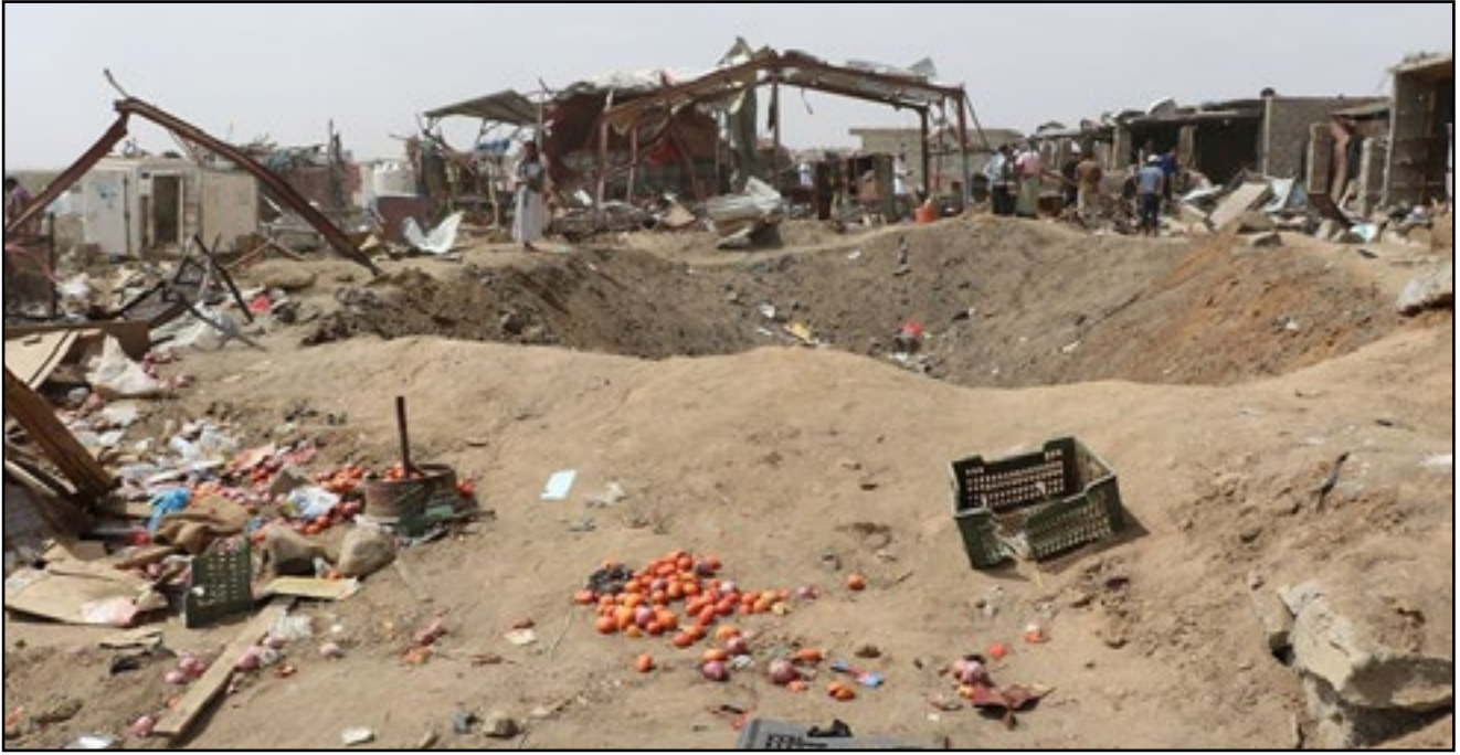
استهداف طيران تحالف العدوان سوق الخميس - مديرية مستبأ بمحافظة حجة 15 مارس 2016م