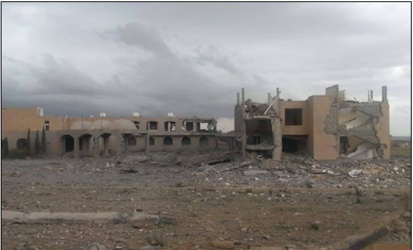
استهداف طيران تحالف العدوان جامعة دمار- محافظة دمار 6 مايو 2015م

98. الجدول رقم (7) المرفق بالمُلحق يبيّن قائمة نماذج المؤسسات والمرافق التعليميّة التي استهدفتها هجماتُ تحالف العُدوان خلال أكثر من خمس سنواتٍ من عُدوانها.