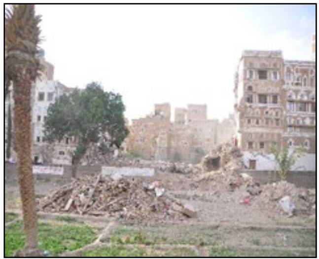
قصف تحالف العدوان لمدينة صنعاء القديمة التاريخية 13 يونيو 2015م