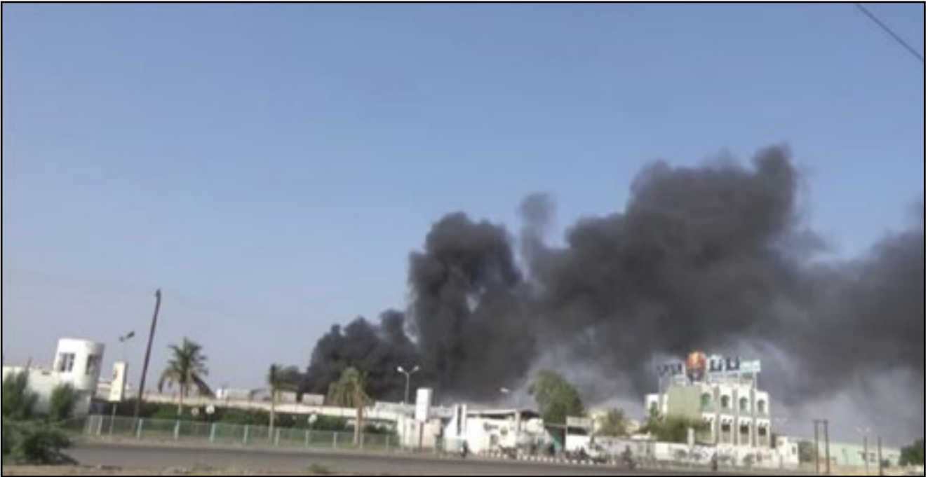
استهداف العدوان ومرتزقته مصنع نانا بمحافظة الحديدة 1 ديسمبر 2018م

65. الجدول رقم (1) المرفق بمُلحق هذا التقرير يُوضِّحُ بعضَ المواقعِ الخاصَّةِ بالموادِّ الغذائيَّةِ التي استهدفتها دولُ تحالفِ العُدوانِ .