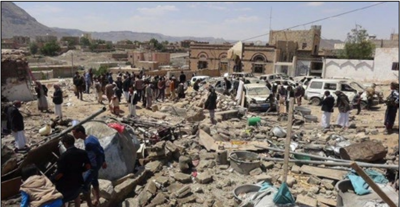
استهداف طيران تحالف العدوان حفل زفاف - منطقة سنبان محافظة ذمار 7 أكتوبر 2015م

76. في مساء يوم الأربعاء الموافق 7 أكتوبر 2015م، شنت طائرات دول تحالف العدوان غارات على منزل ومخيمات عرس في منطقة سنبان أودت بحياة 22 طفلاً، و13 امرأة، و14 رجلاً، وجرحت أكثر من 75 آخرين، معظمهم من النساء والأطفال.