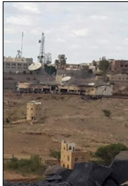
استهداف تحالف العدوان مبنى التلفزيون بالعاصمة صنعاء بتاريخ 11-9-2015م