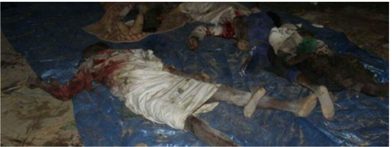
استهداف طيران تحالف العدوان حفل زفاف بمنطقة بني قيس - محافظة حجة 22 أبريل 2018م