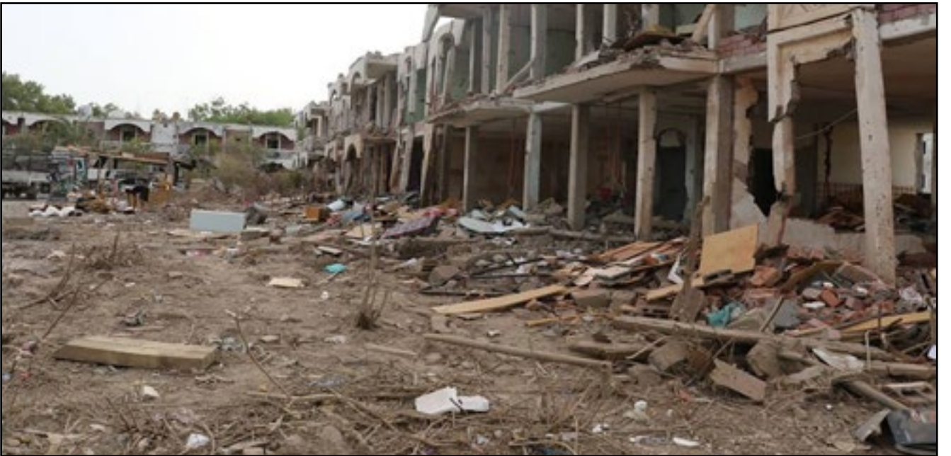
استهداف طيران تحالف العدوان مدينة العمال بالمخا - محافظة تعز 24 يوليو 2015م