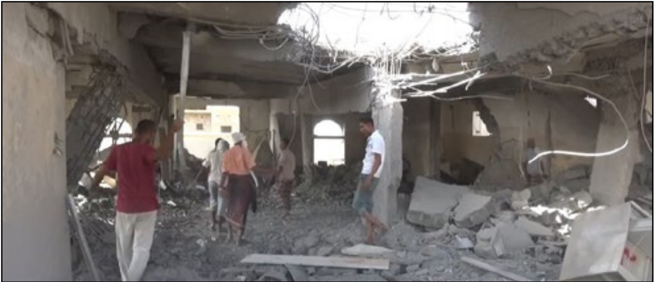
استهداف تحالف العدوان السجن المركزي بمديرية الزيدية - محافظة الحديدة 29 أكتوبر 2016م