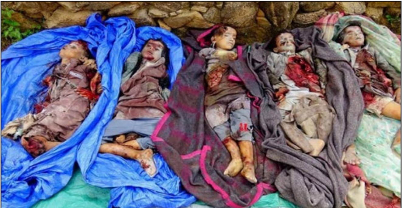
استهداف طيران تحالف العدوان مدرسة تحفيظ قرآن بقرية جمعة بن فاضل- مديرية حيدان بمحافظة صعدة 13 أغسطس 2016م

79. في صباح يوم السبت 13 أغسطس 2016م شنّ طيرانُ دول تحالفِ العُدوانِ غارةً على مدرسة تحفيظ القرآن الكريم في قرية الدوّار حيدان جمعة بن فاضل، إحدى قرى مُديرية حيدان، بمُحافظة صعدة، وقد أدت هذه الغارةُ إلى سُقوط ضحايا من الأطفال ومُدّرسي هذه المدرسة، حيث قُتل 7 أطفالٍ و مُدّرسين اثنين، وكان عددُ المُصابين من الأطفال 21 جريحاً بجروحٍ شديدةٍ، مُعظمهم أدخل العنابة المُركّزة، وقد تُوفي أحدُ الأطفال صباحَ اليوم التّالي؛ ليرتفع عددُ القتلى إلى 8 أطفال.