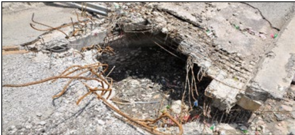
استهداف تحالف العدوان جسر الدليل بمنطقة سمارة - محافظة إب 21 إبريل 2015م