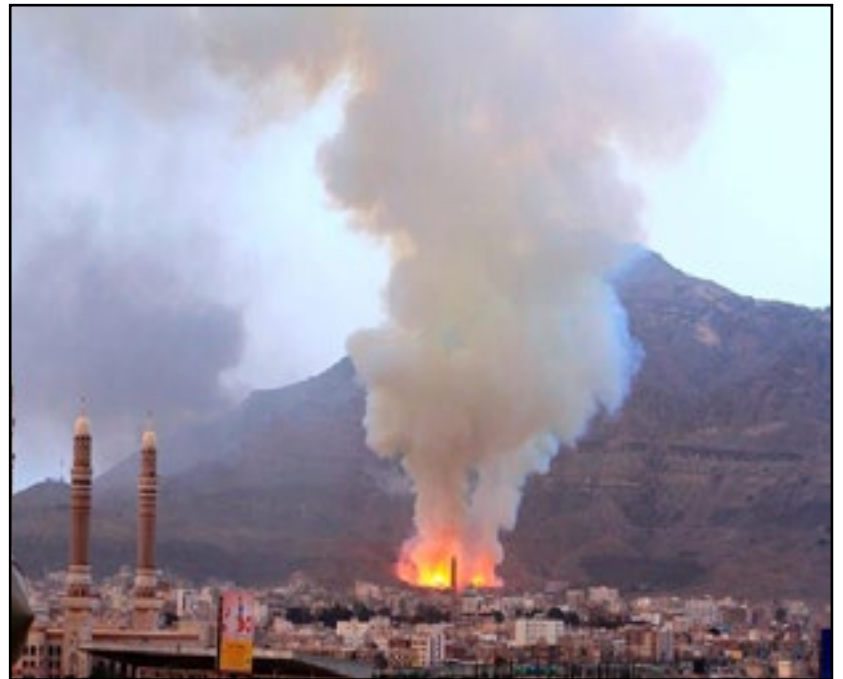
استهداف طيران تحالف العدوان حي نَقَم - العاصمة صنعاء 12 مايو 2015م