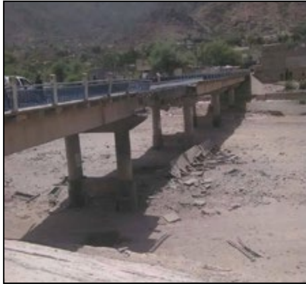
استهداف تحالف العدوان جسر شرس - محافظة حجة 15 سبتمبر 2015م

131. الجدول رقم (14) في الملحق يوضّح شبكات الطرق والجسور وسيارات المواطنين المازة عليها التي استهدفها تحالف العدوان.