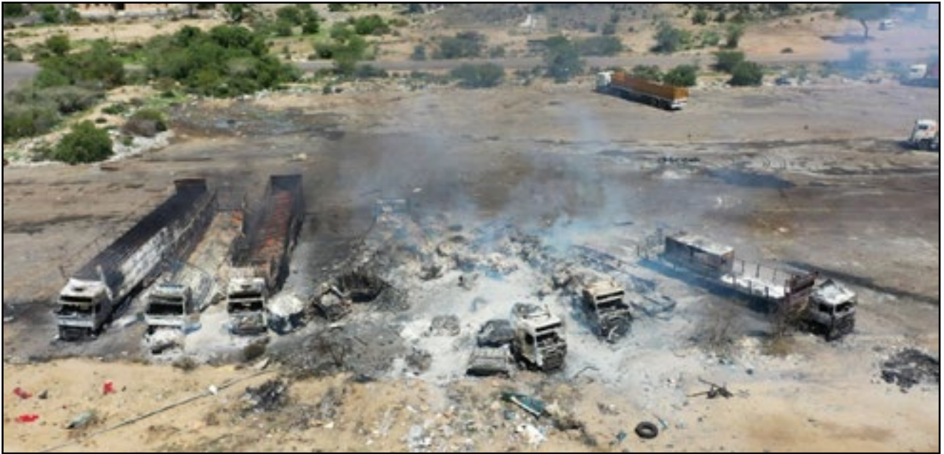
استهداف طيران العدوان لمنفذ عفار الجمركي بمحافظة البيضاء 20 مايو 2020م