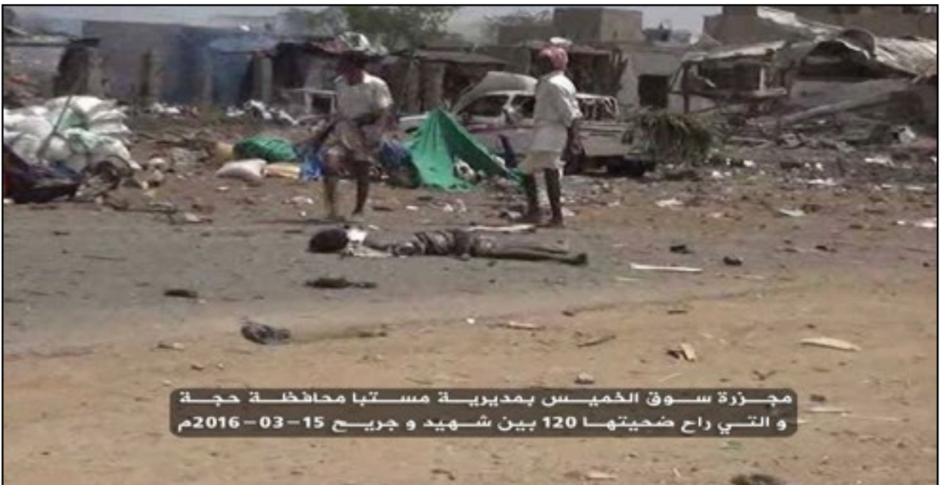
مجزرة سوق الخميس بمديرية مستبأ محافظة حجة و التي راح ضحيتها 120 بين شهيد و جريح 15-03-2016م

78. في 15 مارس 2016م شنّ تحالفُ العدوان ثلاثَ غاراتٍ جويّةٍ مُتتاليةٍ استهدفت سُوقَ الخميس بمُديريةٍ مستبأ بمُحافظة حجة بشكلٍ مُباشرٍ، ممّا أسفر عن مقتل 120 مدنيّاً، منهم 20 طفلاً وامرأةً، وجرح 44 مدنيّاً.