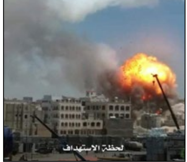
استهداف طيران تحالف العدوان مدرسة الراعي -مديرية شعوب بأمانة العاصمة 7 أبريل 2019م