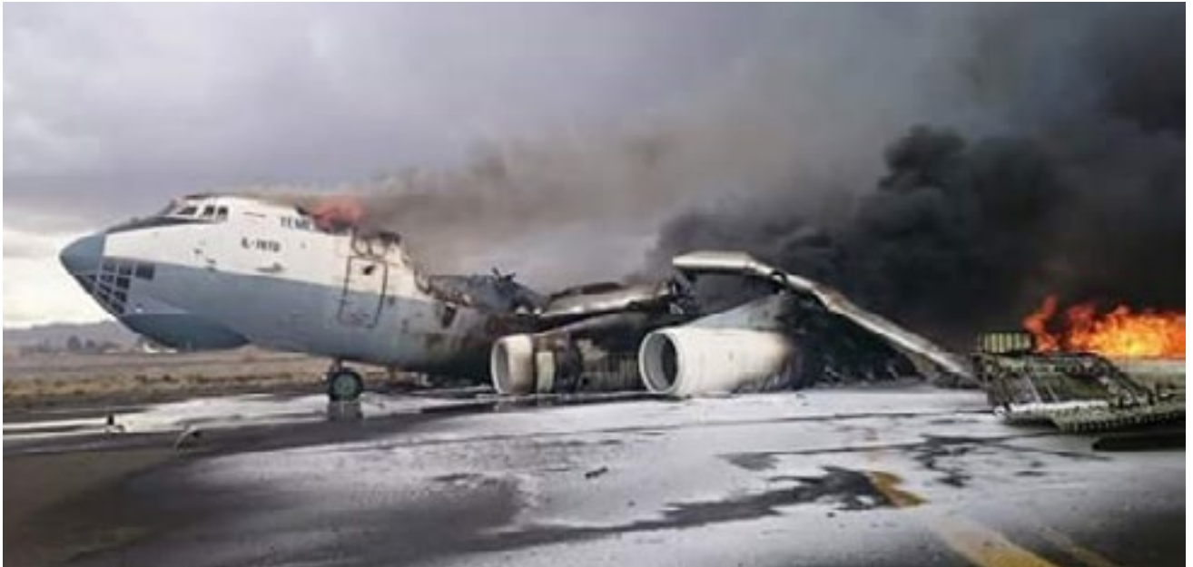
استهداف طيران تحالف العدوان مطار صنعاء الدولي 8 مايو 2015م

113. تسبّب استهدافُ العدوان لقطاع الطيران المدنيّ والأرصاد إلى فقدان ما يقاربُ 80% من العمّال لوظائفهم .