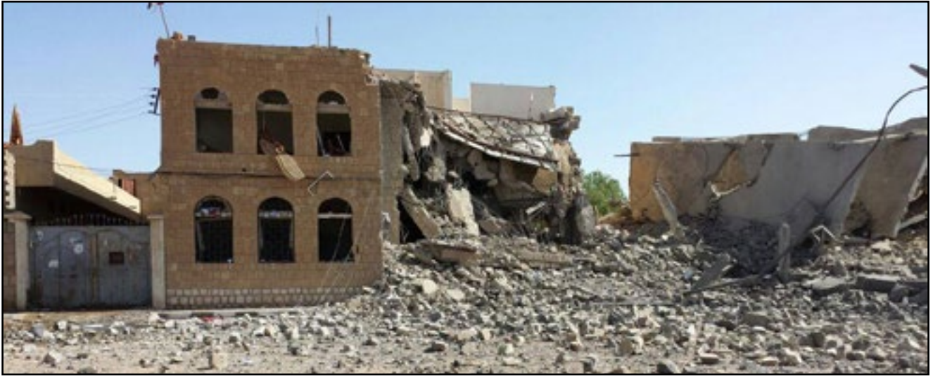
استهداف تحالف العدوان مبنى البحث الجنائي بمدينة صعدة 6 مايو 2015م

127. من أبرز المباني التابعة لوزارة الداخلية - التي استهدفتها دول تحالف العدوان - مبنى وزارة الداخلية، ومبنى الإدارة العامة لحراسة المنشآت، ومبنى قيادة قوات الأمن المركزي، وجميع مباني الأمن المركزي في المحافظات، ومبنى وحدة مكافحة الارهاب، ومبنى قيادة قوات النجدة، وجميع فروعها في المحافظات، ومبنى كلية الشرطة، ومبنى الشرطة الراحلة، ومبنى المركز التدريبي بدمار، ومبنى الإدارة العامة للأدلة الجنائية، ومبنى مصلحة الجوازات والهجرة والجنسية، ومركز الإصدار الآلي بأمانة العاصمة، ومركز الإصدار الآلي بتعز والإصدار الآلي بالحديدة، ومبنى مصلحة خفر السواحل بالحديدة وعدن، وسجون عدن وعمران والحديدة وتعز، وعدد من السجون في المديريات، ومباني الإدارات الأمنية في المحافظات والمديريات، وجميع النقاط الأمنية الواقعة بين المحافظات، بالإضافة إلى سيارات الشرطة الثابتة في مواقعها والمتحركة بين المدن؛ بالإضافة إلى تدمير سيارات وعربات الدفاع المدني المعنية بإنقاذ أرواح الناس من تحت الأنقاض وإطفاء الحرائق الناجمة عن قصف طيران تحالف العدوان، والحيلولة دون أداؤها لواجباتها في الحد من الكوارث والحرائق وإنقاذ الأرواح والممتلكات.