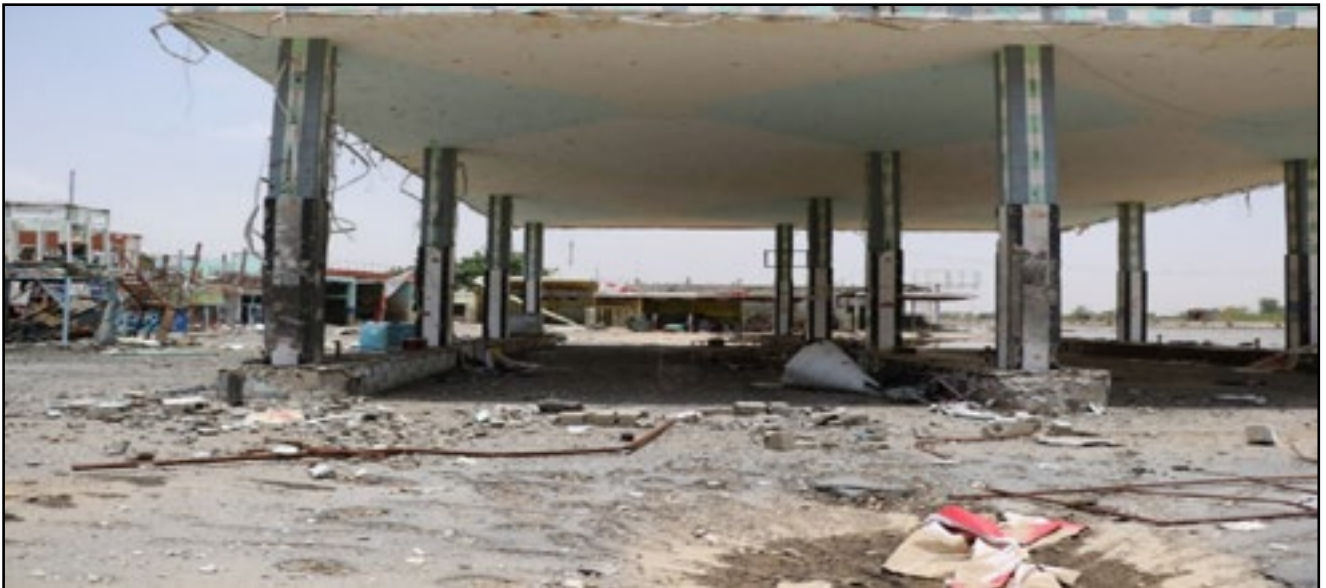
استهداف تحالف العدوان محطة وقود بحرض - محافظة حجة 6 يونيو 2015م