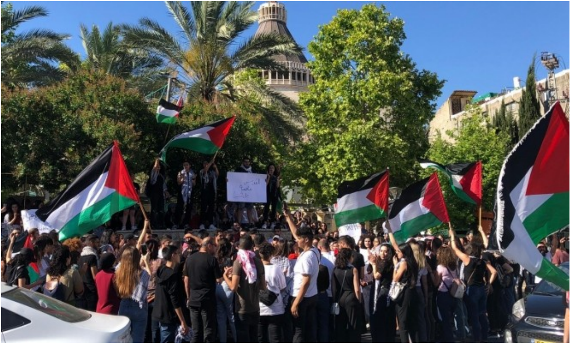
من التظاهرة الاحتجاجية في الناصرة

وفي الناصرة، نُظمت تظاهرة احتجاجية في المدينة، تنديداً بالعدوان الإسرائيلي على القدس وقطاع غزة كذلك، ورفع المشاركون في التظاهرة الأعلام الفلسطينية ولافتات نصر للقدس وقطاع غزة، وكتب على بعض منها "أنقذوا الشيخ جراح"، و"القدس عاصمة فلسطين"،