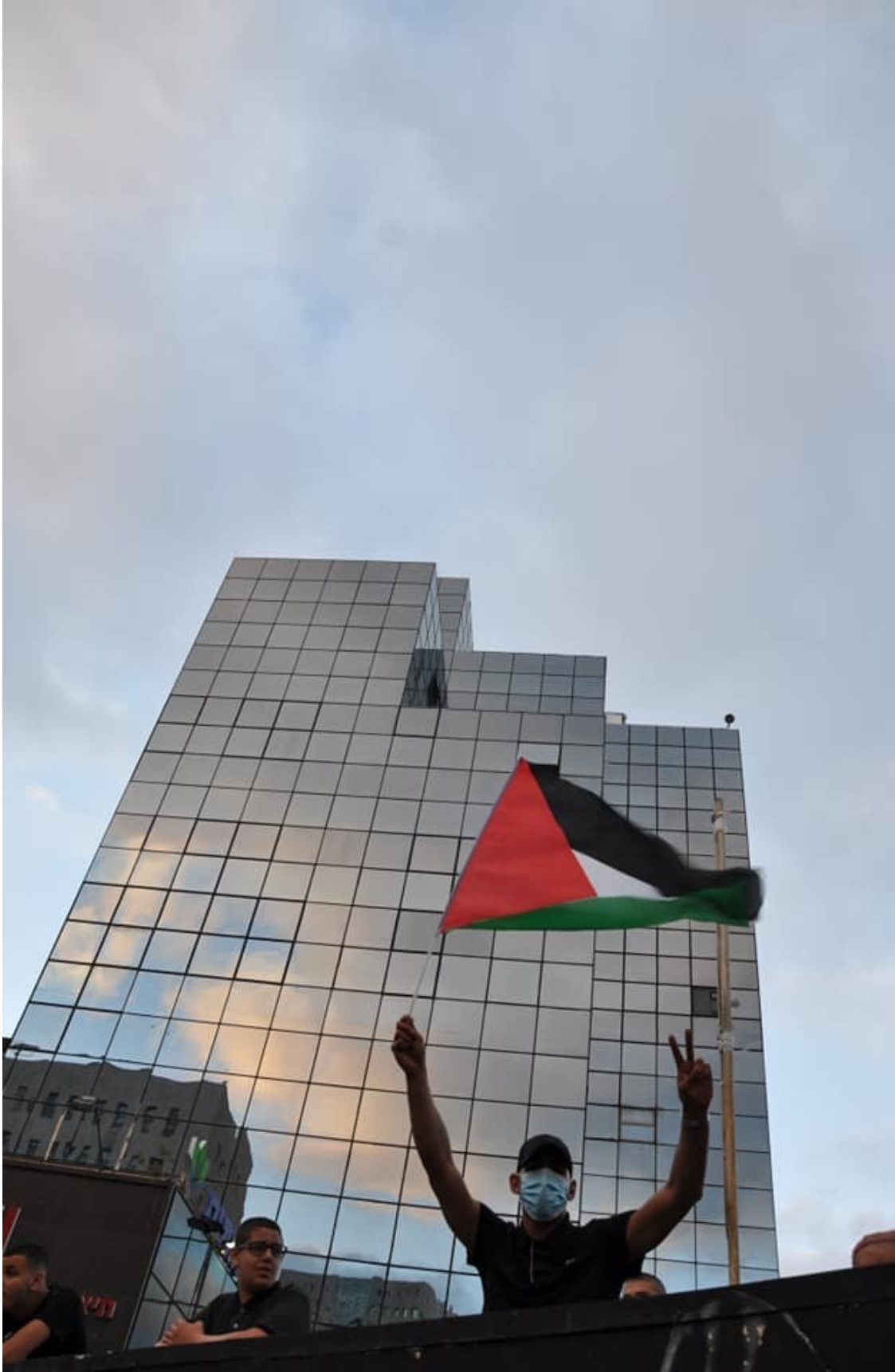
متظاهرون في حيفا