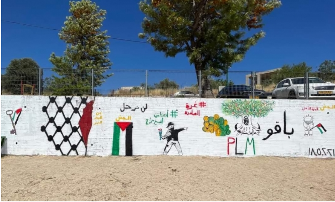
جدارية الجش، أمس

اتهم الحراك الجشي المستقل في قرية الجش، شمالي البلاد، عمالا من مجلس الجش المحلي بمحو جدارية "إضراب الكرامة"، يوم أمس الثلاثاء.