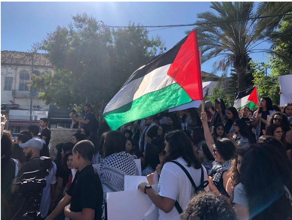
مشاركون في مظاهرة الناصرة