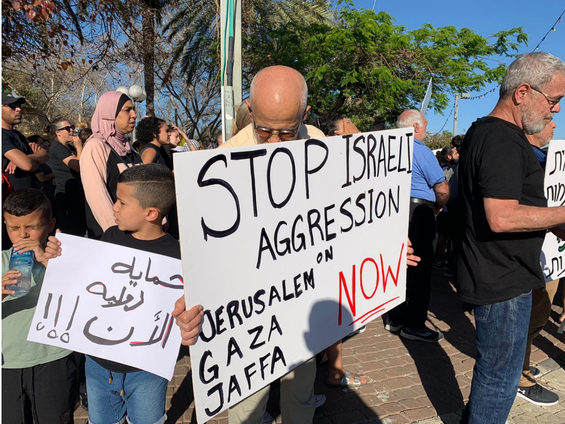
لافئات رُفعت في يافا