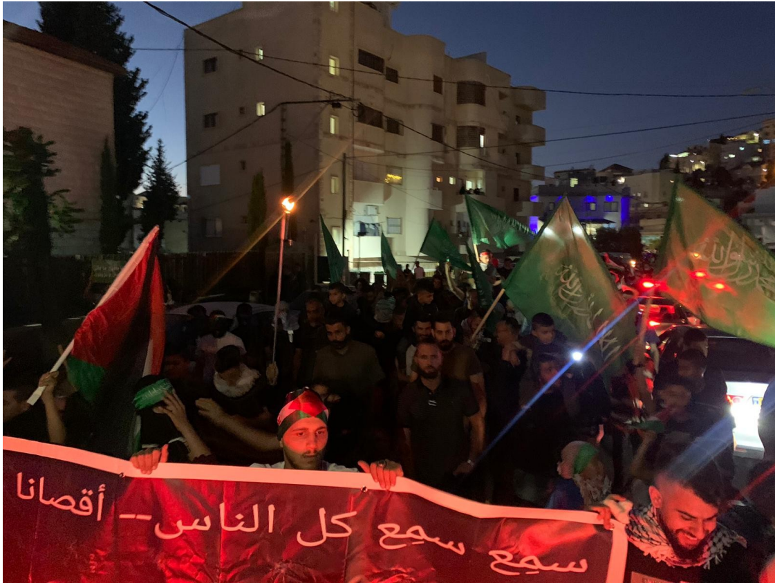
متظاهرون في أم الفحم