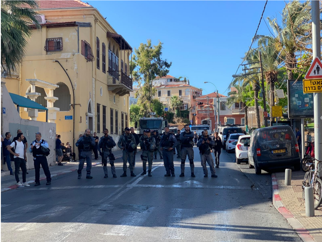
استنفار الشرطة في يافا

كما هتف المتظاهرون بهتافات مطالبة بإيقاف العدوان الإسرائيلي على قطاع غزة، ومناصرة لأهالي القدس، وبخاصة حيّ الشيخ جراح، ومطالبة بالوحدة.