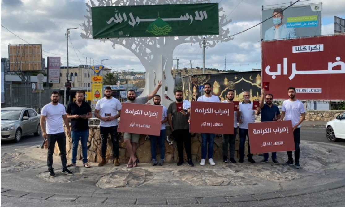
مدخل البعنة صباح يوم الكرامة

عم الإضراب الشامل، أمس الثلاثاء، البلديات العربية في الداخل الفلسطيني والضفة الغربية المحتلة، وذلك للتنديد بالعدوان الإسرائيلي على قطاع غزة والقدس والمسجد الأقصى وحي الشيخ جراح، واعتداءات المستوطنين على المواطنين العرب في البلاد.