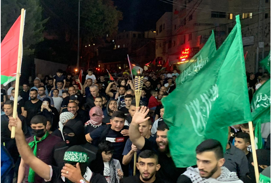
متظاهرون في أم الفحم

وكان من المقرر أن تنطلق المظاهرة لاحقا، في مسيرة، تمرّ من حيّ وادي السناس، والجادة الألمانية، والبلدة "التحتى"، وأحياء مركزية، وسط المدينة، إلا أن الشرطة منعت ذلك. وفي أم الفحم، شارك الآلاف في مسيرة المشاعل في المدينة. وانطلقت المسيرة من حيّ "عين النبي" حيث تجمّع المشاركون، لتتجه المسيرة بعدها، نحو حيّ الشاغور في المدينة.