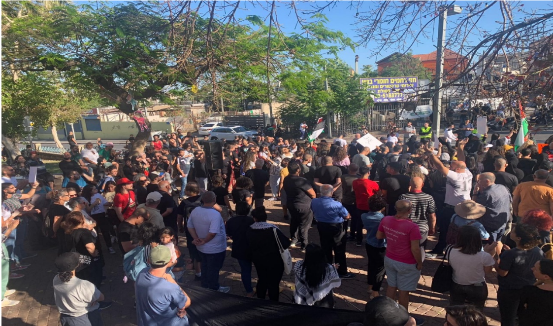
مشاركون في تظاهرة يافا

وفي مدينة يافا، نُظِّمت تظاهرة حاشدة في حديقة الغرازوة في شارع "ييفت"، احتجاجا على الاعتداءات على أهالي المدينة، ونصرة لغزة وحيّ الشيخ جراح المقدسيّ.