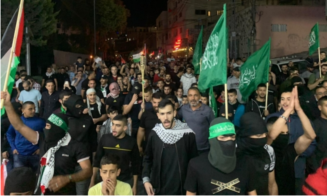
مسيرة مشاعل في أم الفحم، الليلة الماضية

نفذت الشرطة الإسرائيلية، الليلة الماضية، حملة اعتقالات في عدة بلدات عربية على خلفية الاحتجاجات ضد العدوان على القدس وقطاع غزة واعتداءات المستوطنين على مواطنين عرب في البلاد.