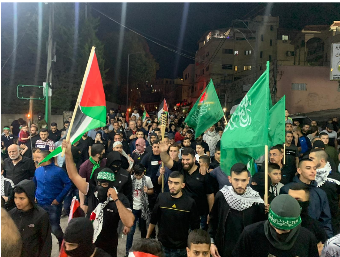
متظاهرون في أم الفحم