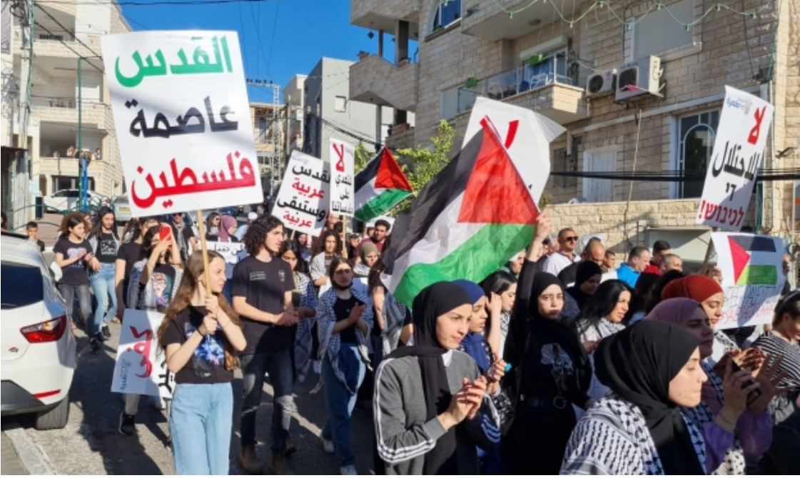
جانب من المشاركين في المسيرة في طمرة

انطلقت، مساء أمس الثلاثاء، مظاهرات احتجاجية حاشدة في بلدات عربية، ضدّ العدوان الإسرائيليّ في قطاع غزة المحاصر، والضفة الغربية والقدس المحتلتين، واحتجاجاً على اعتداءات الشرطة الإسرائيلية، وعصابات المستوطنين على بلدات عربية.