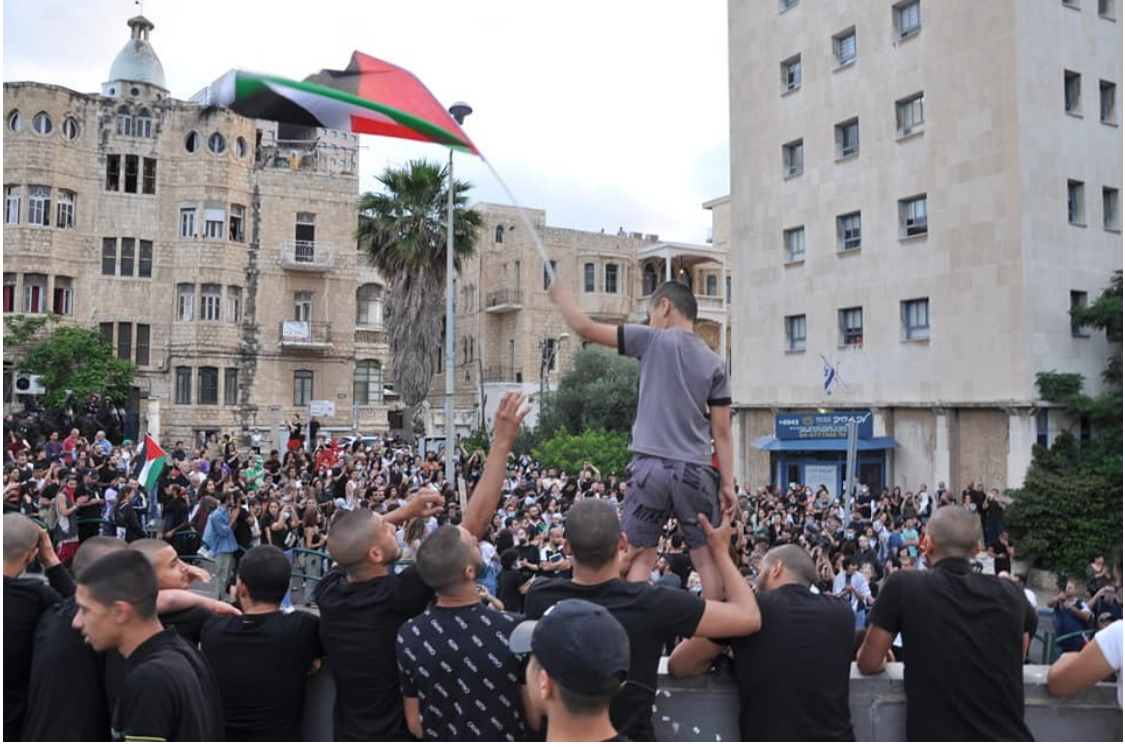
متظاهرون في حيفا

وكان من المقرر أن تنطلق المظاهرة لاحقا، في مسيرة، تمرّ من حيّ وادي السناس، والجادة الألمانية، والبلدة "التحتى"، وأحياء مركزية، وسط المدينة، إلا أن الشرطة منعت ذلك. وفي أم الفحم، شارك الآلاف في مسيرة المشاعل في المدينة. وانطلقت المسيرة من حيّ "عين النبي" حيث تجمّع المشاركون، لتتجه المسيرة بعدها، نحو حيّ الشاغور في المدينة.