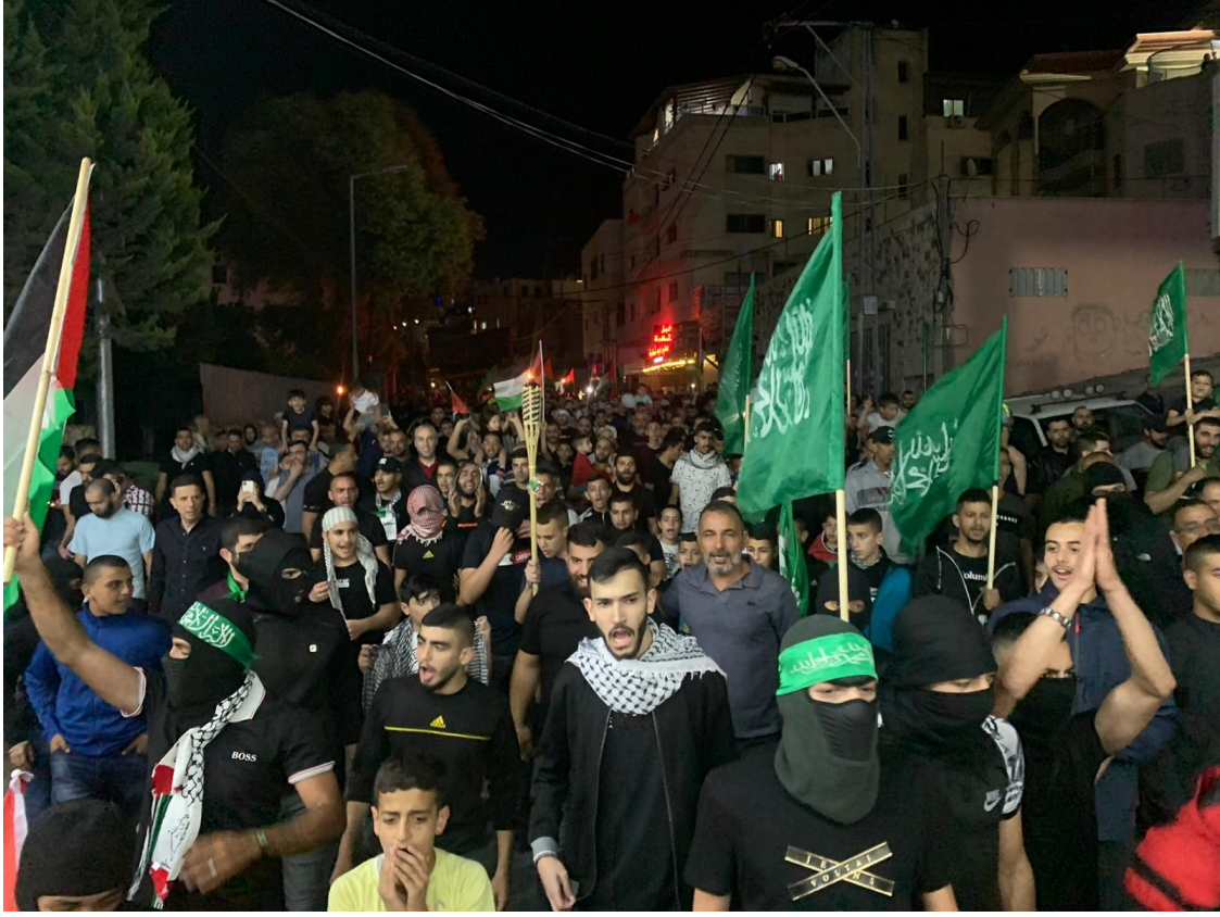
متظاهرون في أم الفحم

وهتف المتظاهرون، بشعارات مناصرة للغزيين والمقدسين، أمام ما يواجهون من عدوان إسرائيلي. وشهدت المسيرة مشاركة واسعة من شرائح عمرية مختلفة.