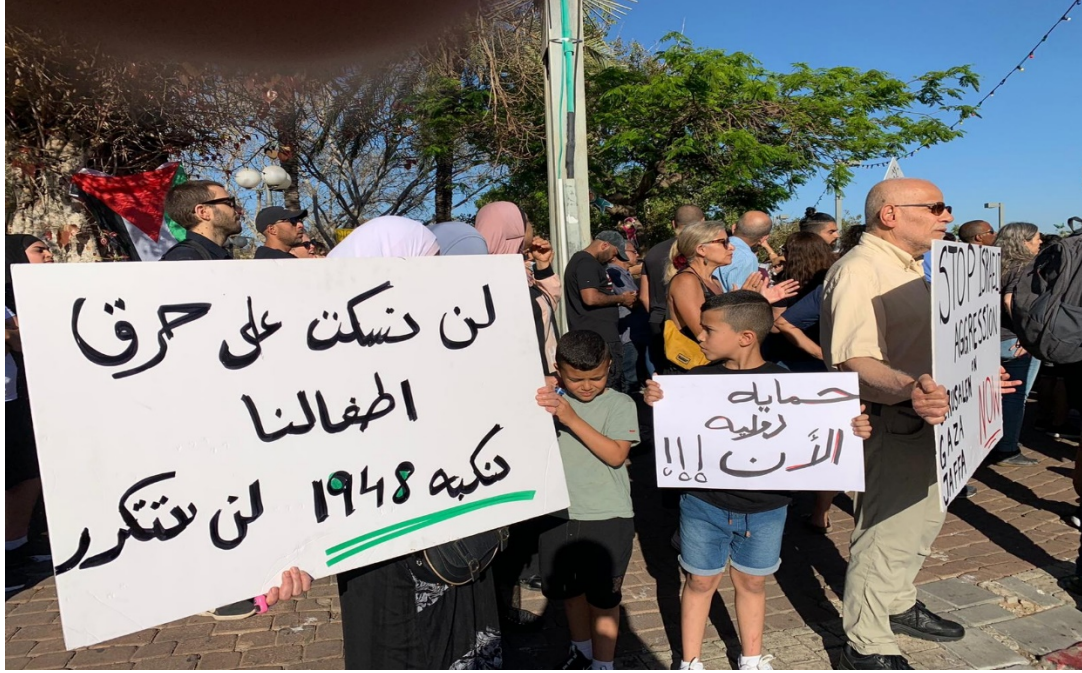
أطفال يافا يطالبون: "حماية دولية الآن"

وشهدت منطقة التظاهرة استنفارا كبيرا من قبل الشرطة، التي عززت قواتها الخاصة بالعشرات، بالإضافة إلى سيارة المياه العادمة.