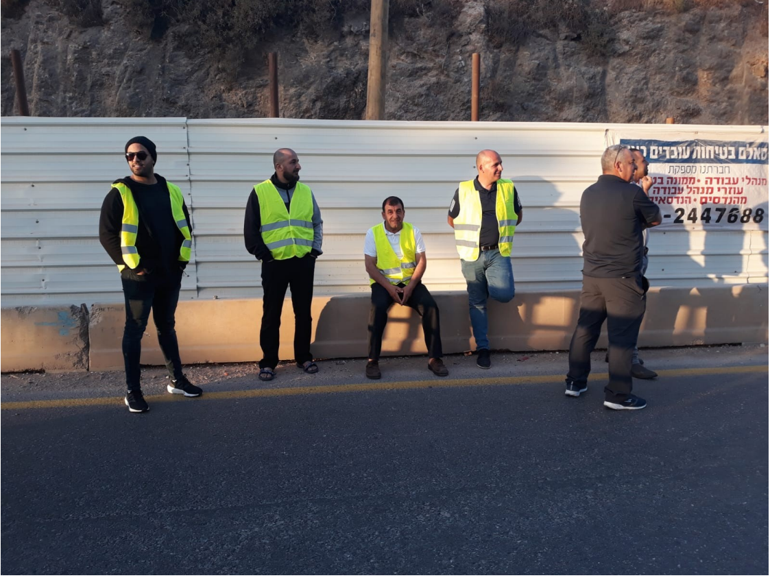
أعضاء لجنة السلم الأهلي في دير حنا

ورغم التزام اللجنة بعملها، ومحافظتها على سلمية الاحتجاج، إلا أن أحد عناصر الشرطة، والذي وصل إلى المفرق الشرقي للبلدة، قام بتهديد الشبان، وسرعان ما توافدت قوات من الشرطة على المفرق الغربي وباشرت بإطلاق قنابل الصوت والغاز. ولفت إلى أنه عند وصول الشرطة إلى المفرق الشرقي، ورغم عدم تواجد أي شخص في المفرق، أطلقت العديد من قنابل الغاز في المنطقة، أصابت إحداها بيت أحد أصحاب الإعاقات.