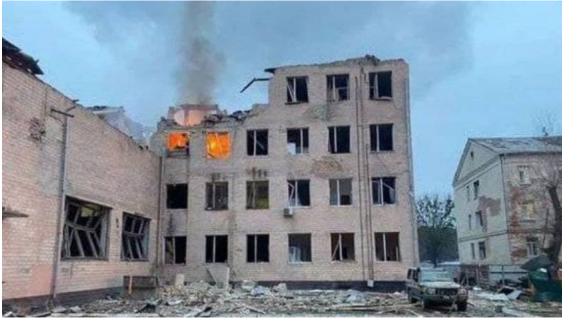
المركز 72 بعد الضربة الروسية، 24 فبراير

لعب القسم (72 عمليات نفسية) دوراً خاصاً منذ السنوات الأولى لوجوده كونه عصب المراكز الثلاثة الأخرى إذ كان لديه قوة بشرية متخصصة يتراوح عديدها بين (150- 250) شخصاً وتم تطويرها بشكل مستقل في بيئة المعلومات. كما قامت بتنسيق أنشطة المراكز الأخرى وكانت مسؤولة عن التفاعل مع الهياكل الأجنبية ذات الصلة.