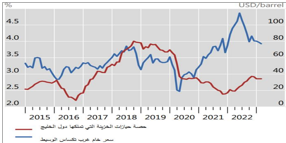
الشكل رقم 3: تطوّر اكتتاب دول الخليج النفطية في سندات الخزينة الأمريكية

ولذلك كان من البديهي توقع استجابة بعض المصدّرين لرغبات زبائنهم الجدد الأكثر أهمية (سواء لناحية التسهيلات بالدفع أو التسديد بعملات أخرى غير الدولار)، طالما أن ذلك يجعل تأثيرات الدولار على اقتصادياتهم في حده الأدنى. وليس مفاجئاً أن يكون هذا التغيير موضع ترحيب من قبل مستوردي السلع (النفط تحديداً) لأنه يحمي اقتصاداتهم من تأثيرات الركود التضخمي المصاحب لارتفاع أسعار النفط وقيمة الدولار معاً. ومما يدعم هذه الفكرة توفر بعض البيانات التي تشير إلى تقليص الاستثمارات الخليجية في سندات الخزينة الأمريكية، حتى مع ارتفاع أسعار النفط وما صاحبها من زيادة كبيرة في العائدات المالية (الشكل 3 أدناه). الأمر الذي قد يشكل مؤشراً إضافياً على أن جزءاً كبيراً من هذه الصادرات قد تمت فوترته بغير الدولار.