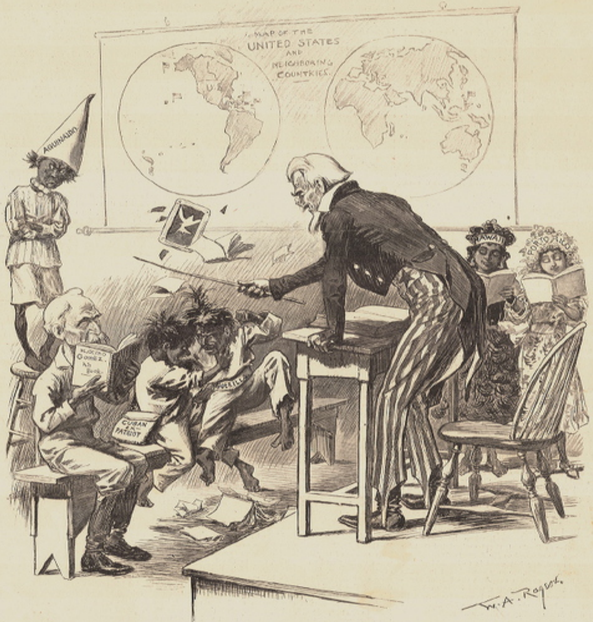
UNCLE SAM'S NEW CLASS IN THE ART OF SELF-GOVERNMENT.