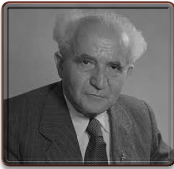
ديفيد بن جوريون

هذه نبذة أو عينة عن التغطية الإعلامية العبرية اليومية وعلى مدار الساعة حول الموضوع، ومدى تأثيره على الحالة الداخلية والأوضاع الإسرائيلية، فالكامل يرى أنها كارثة وبداية لحرب أهلية وديكتاتورية تعبّر عن فساد سلطوي. وقد استعملت الشرطة العنف ضدّ المتظاهرين، وتمرد الضباط، وحصل شرح بين كل المستويات والطبقات والفئات في الكيان، الذي يقوله الإسرائيليون اليوم ويمارسونه أيضاً أنهم في حالة انقسام وانشطار حاد، وأن هناك شرخاً يصعب ردمه أو إعادة التئامه؛ لأنه أعمق من أن يستطيع أحد علاجه، وإذا نظر المتابع إلى الحوارات على البرامج الإخبارية وسمع أقوالهم، حتى مقابلات الشارع، سوف يكتشف بسهولة ويسر كم هو الصدع القائم بينهم نتيجة الانقلاب الذي تسميه الحكومة إصلاحات قضائية، حتى بعد انتظار طويل لظهور نتيهاهو لقول كلمة الفصل، خرج في مؤتمر صحفي محيياً للآمال مصرّاً على الماضي في التغييرات التي يريدتها هو وحكومته، 50 فأثار موجة من السخط والانتقاد، وهو الذي كان من المفترض أن يأتي بجديد، ولكنه أكد على الماضي قدماً ولم يراعِ غليان الشارع، ولا نصف الشعب الثائر.