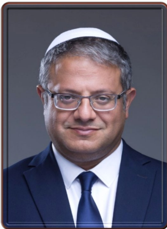
إيتمار بن غفير

ذاهب إلى النهاية، على الرغم من أن رئيس الشاباك (Israel Security Agency—ISA (Shabak) السابق يوفال ديسكين Yuval Diskin حدّر من حرب أهلية وشيكة. 32 أما مائير كوهين باحث في معهد أبحاث الأمن القومي الذي يديره عاموس يدلين رجل الموساد السابق، فرأى أن ما يحدث أزمة عميقة وخطرة جداً، وتهدد الجميع وليس فئة معينة، وهو الموقف نفسه الذي عبّر عنه رئيس الدولة حاييم هيرتزوج في أن ما يحدث هو أزمة عميقة وخطرة، وأنه من موقعه كرئيس للدولة سوف يقدم مقترحاً لحل الأزمة، وقدمه فعلاً، لكنه رُفض من الحكومة. 33