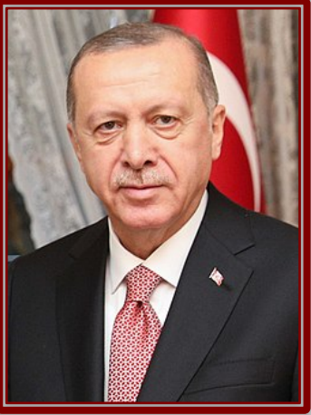
رجب طيب أردوغان

بينما في المسار الحالي، أي منذ نهايات 2020، كانت الرغبة مشتركة من مختلف الأطراف، وهو ما أسهم في حالة من التهدئة بين تركيا وهذه الدول والتي ارتقت لحالة من الحوار وفي أحيان نادرة للتنسيق والتعاون، كما في الملف الليبي على سبيل المثال.