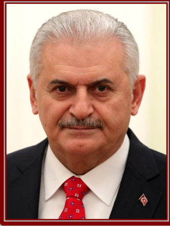
بن علي يلدرم

منذ ما يقرب من عامين، تسعى تركيا لتخفيف حدة الخلاف والاستقطاب وفتح قنوات الحوار مع عدد من الأطراف الإقليمية، التي وقفت منها موقف النقيض خلال العقد الماضي تحديداً (2010-2019)، وفي مقدمتها مصر والإمارات والسعودية. وكانت تركيا قد سعت لشيء من هذا القبيل في 2016 مع حكومة بن علي يلدرم Binali Yıldırım التي رفعت شعار "تكثير عدد الأصدقاء وتقليل عدد الخصوم"، لكنها لم تلقَ في حينه تجاوباً من الأطراف الأخرى إلا بشكل محدود ومؤقت. 4