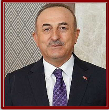
مولود جاويش أوغلو

وتعاون بين جهاز الاستخبارات التركية والموساد الإسرائيلي. 16 وتكرر إحباط السلطات التركية عمليات يقف خلفها إيرانيون على أراضيها خلال 2022، 17 كما أوقفت خلية إيرانية كانت تخطط لاغتيال شخصيات إسرائيلية، وفق وسائل إعلام. 18